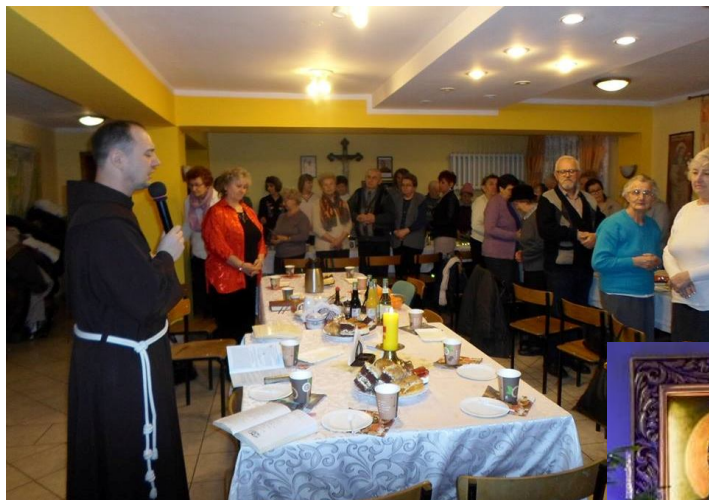
13 stycznia 2018 Spotkanie noworoczne uroczysta Msza św., spotkanie w refektarzu