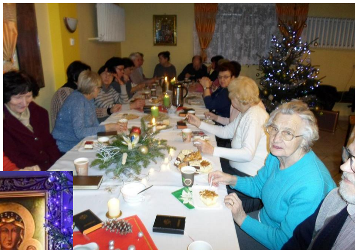
Żywego Różańca: modlitwa różańcowa, przy śpiewie kolęd i poczęstunku.