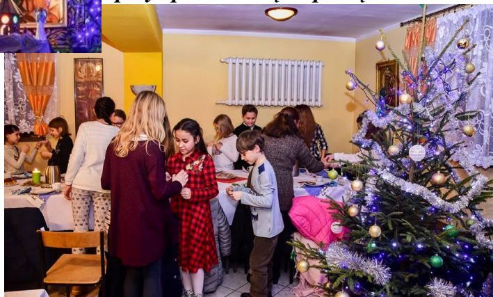
Dzieci Maryi i Schola na spotkaniu oplatkowym