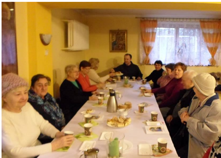
XXVI Światowy Dzień Chorego w naszej Parafii: Msza św. z udzieleniem sakramentu namaszczenia chorych, nabożeństwo zakończone błogosławieństwem lourdzkim oraz radosne spotkanie przy stole w refektarzu klasztornym (10.02.2018 r.)