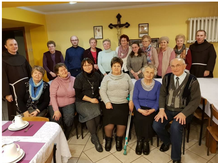
Świecka Rodzina Franciszkańska przy naszej parafii. Wizytacja 4.02.2018 r.