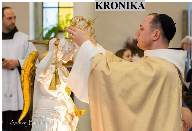
Powitanie Figury św. Michała Archaniola