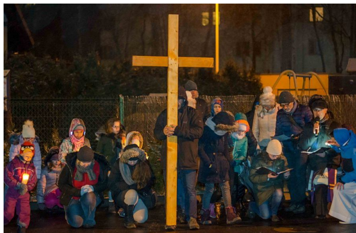
Droga Krzyżowa ulicami parafii 16 marca br.