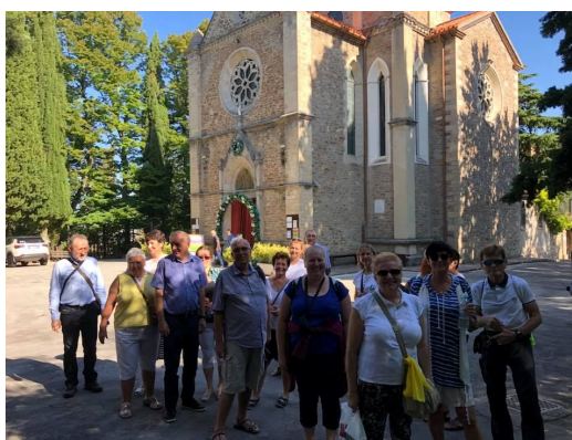
Montepaolo, jedna z pustelni św. Antoniego