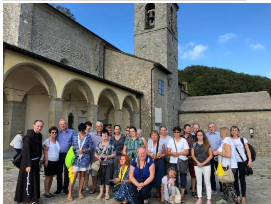
La Verna, gdzie św. Franciszek otrzymał stygmaty