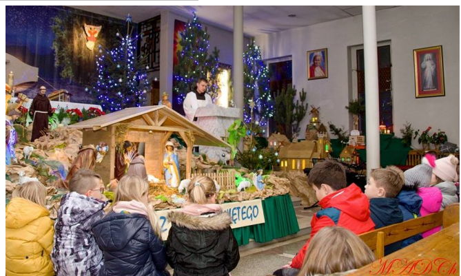
Dzieci u Jezusowego żłobka w naszym kościele