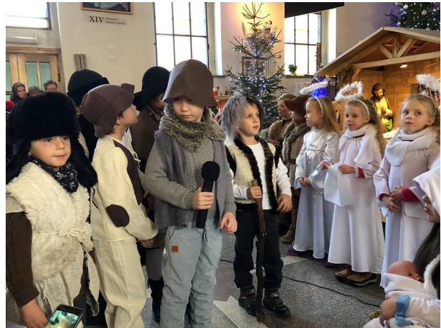
19.01.2019 Jasełka w wykonaniu dzieci z Przedszkola nr 80