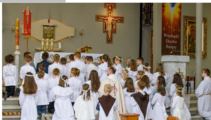
2.06.2019 W naszej parafii niedziela budzenia powołań